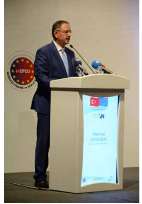
Çevre ve Şehircilik Bakanı Mehmet Özhasseki

Özhasseki, son yıllarda dünya gündeminde önemli bir yere sahip olan, 2016 yılında uluslararası düzeyde 12 toplantının gerçekleşmesini sağlayan iklim değişikliğini konusunda kamu kuruluşlarının, üniversitelerin, sivil toplum örgütlerinin ve gönüllülerin el ele vererek önemli çalışmalar yaptıklarını ve iklim değişikliği konusunu gündemde tutmaya çalıştıklarını aktardı. İklim değişikliğine karşı alınacak önlemler konusunda ufuk açıcı çalışmaların gerçekleştirildiğini belirten Özhasseki, bu durumdan memnuniyet duyduklarını ifade etti.