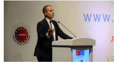
İklim Değişikliği Daire Başkanı Mehrali Ecer

Daha sonra kürsüye gelen İklim Değişikliği Daire Başkanı Mehrali Ecer Türkiye'deki iklim değişikliği alanında yapılan çalışmalar hakkında konuştu.