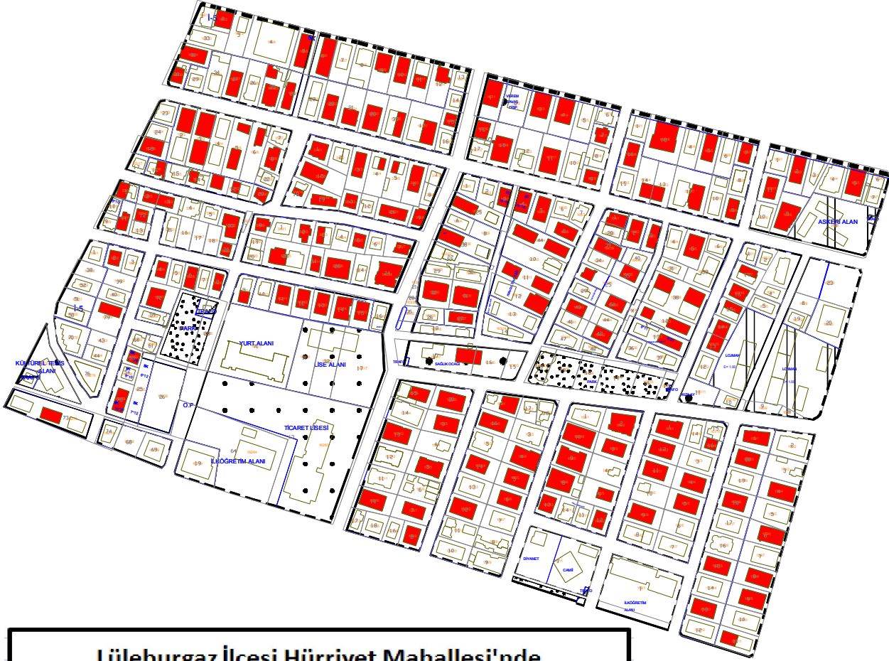
Lüleburgaz İlçesi Hürriyet Mahallesi'nde 7,79 ton Olarak Belirlenen Karbon Salınım Ortalamasının Veri Dağılımını Gösterir Grafik